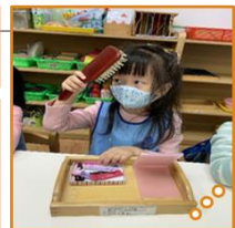
○ 衣飾櫃 ○○ 倒水 ○○○ 整理頭髮 ○○○○ 整理書包 ○○○○ 擰毛巾