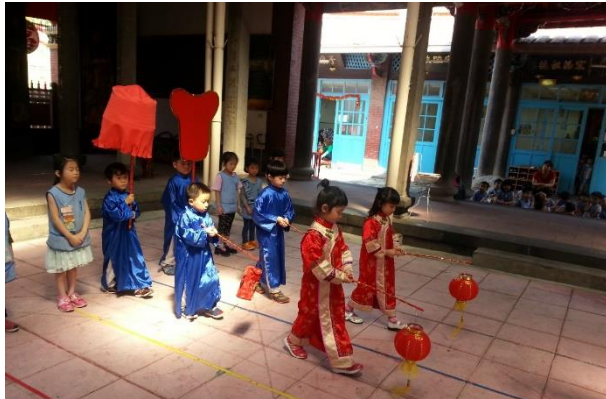
圖為大班的體驗活動.無涉及宗教信仰喔

陳德星堂 每年兩次 ~ 春冬祭典 (農曆11/15 & 2/15) ~ 會使用到教室。 所以每學年度可能會有上課半天2次的機會