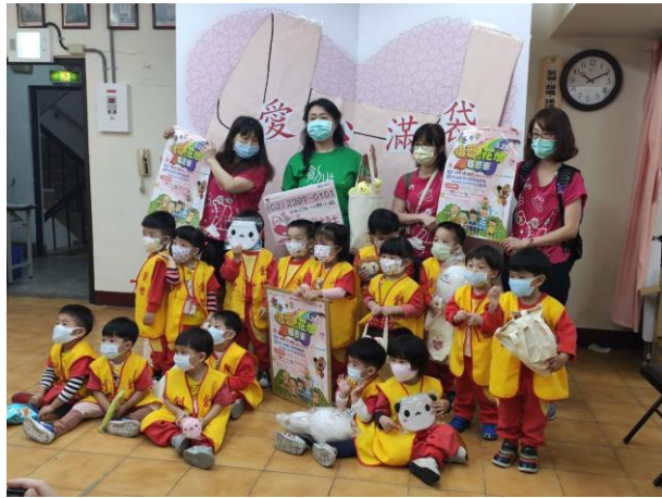
每年定期寒冬送暖