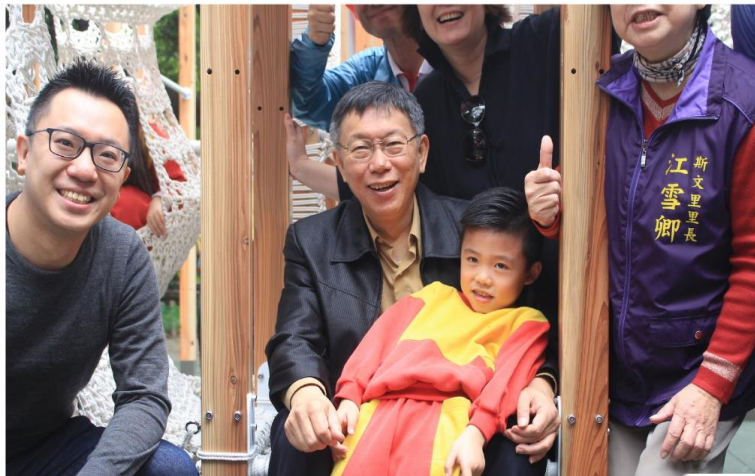
總統府歲 末童樂會