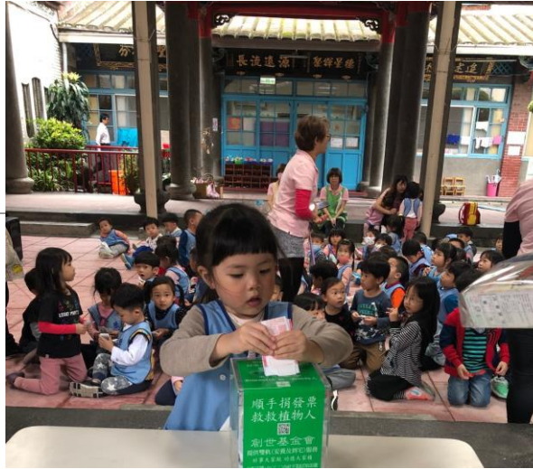
每年不定期 創世基金會 捐發票送愛心